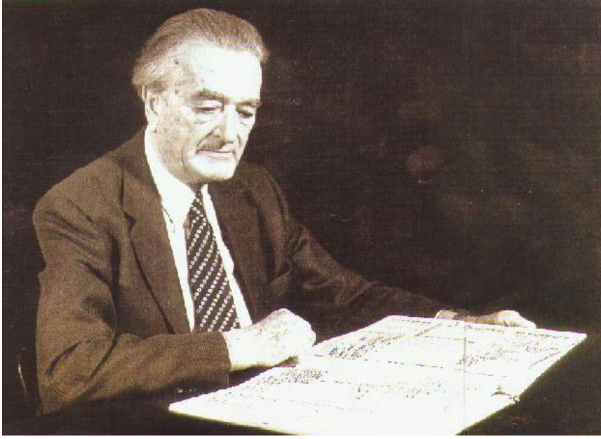
Ahmed Adnan Saygun